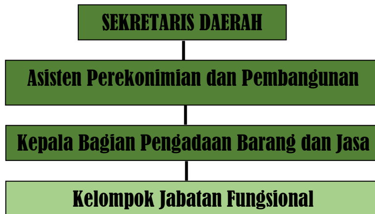
Gambar 2 Bagan Organisasi Bagian Pengadaan Barang dan Jasa Setda Kabupaten Jember

Struktur organisasi Bagian Pengadaan Barang dan Jasa Setda Kabupaten Jember digambarkan pada Gambar.