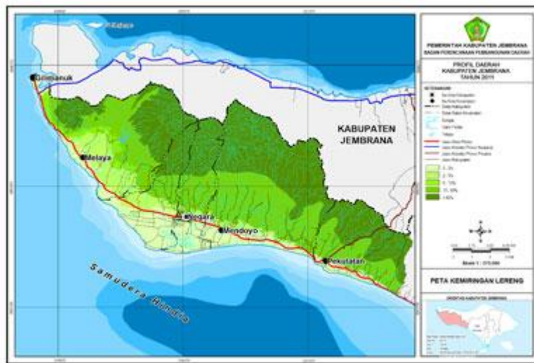
Peta Kemiringan Lereng Kabupaten Jembrana

Secara Hidrologi, sumber air yang ada di wilayah Kabupaten Jembrana meliputi: